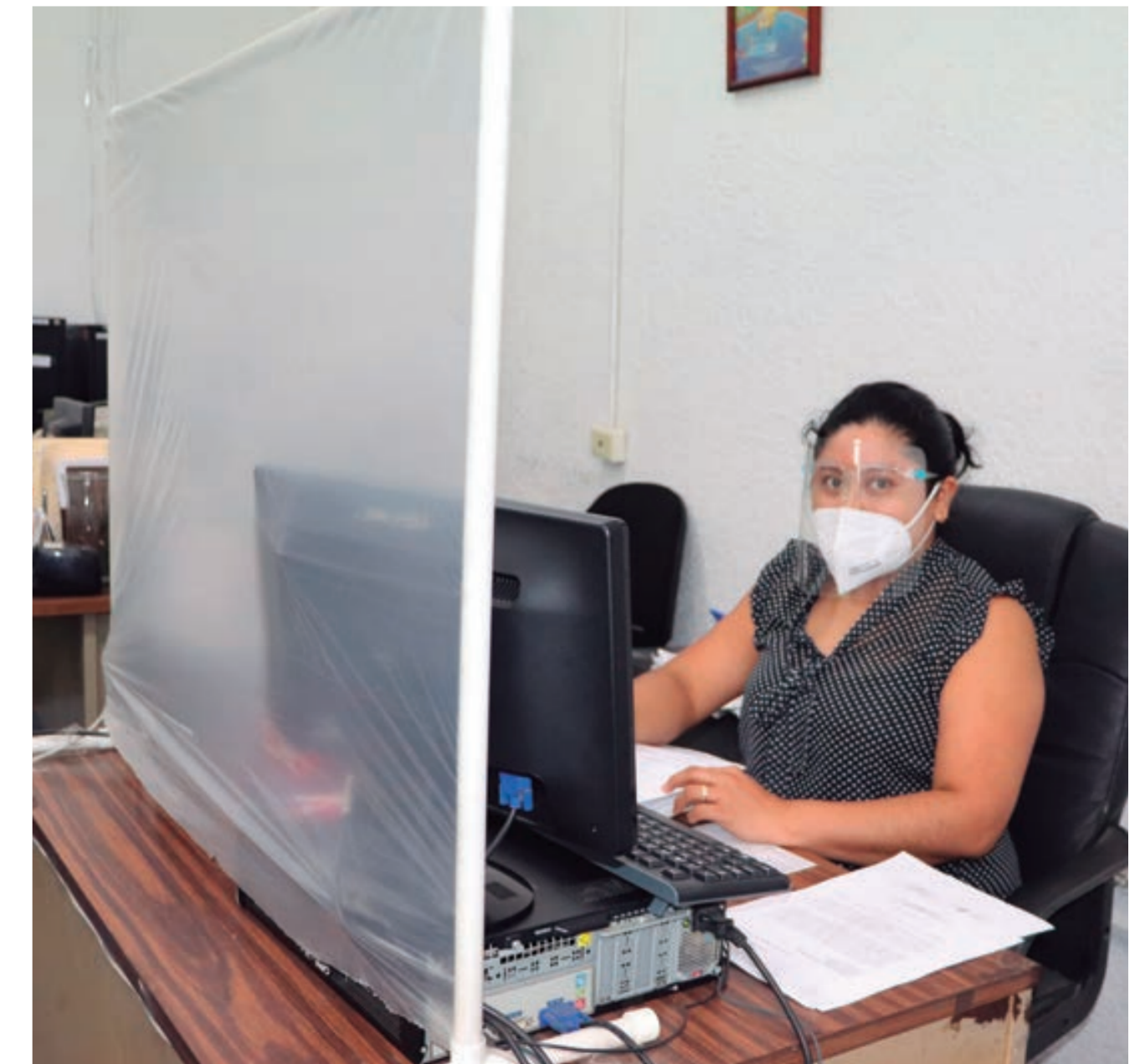
Servidora Pública de la CEDH