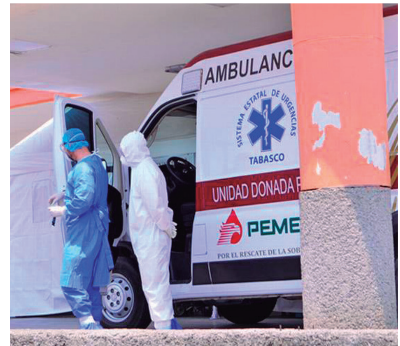
Personal Médico de Salud en Tabasco