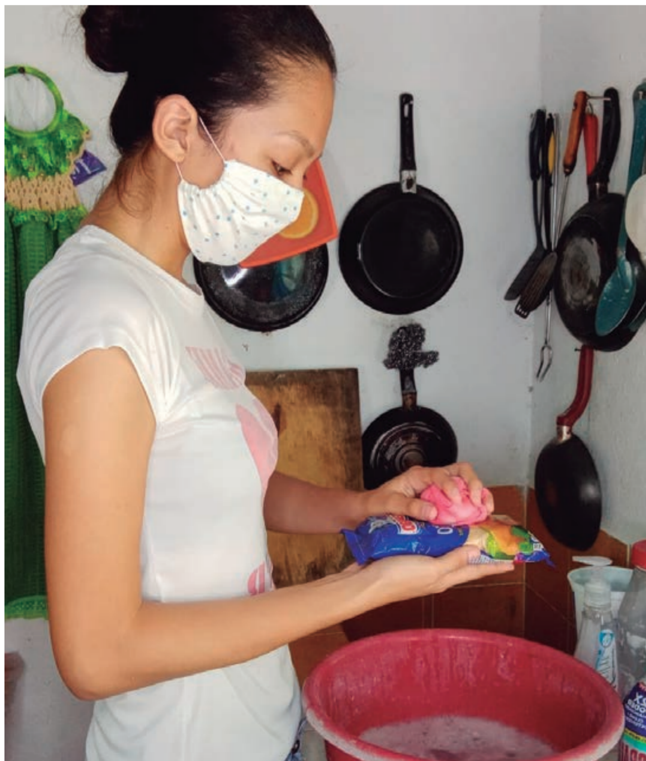
Ciudadana en casa, siguiendo las recomendaciones

El virus aún no termina. Es cierto que la sociedad tiene que continuar, por ello, nuestras autoridades han quitado ciertas restricciones. Ahora nos toca decidir en lo individual y contribuir a proteger nuestra salud.