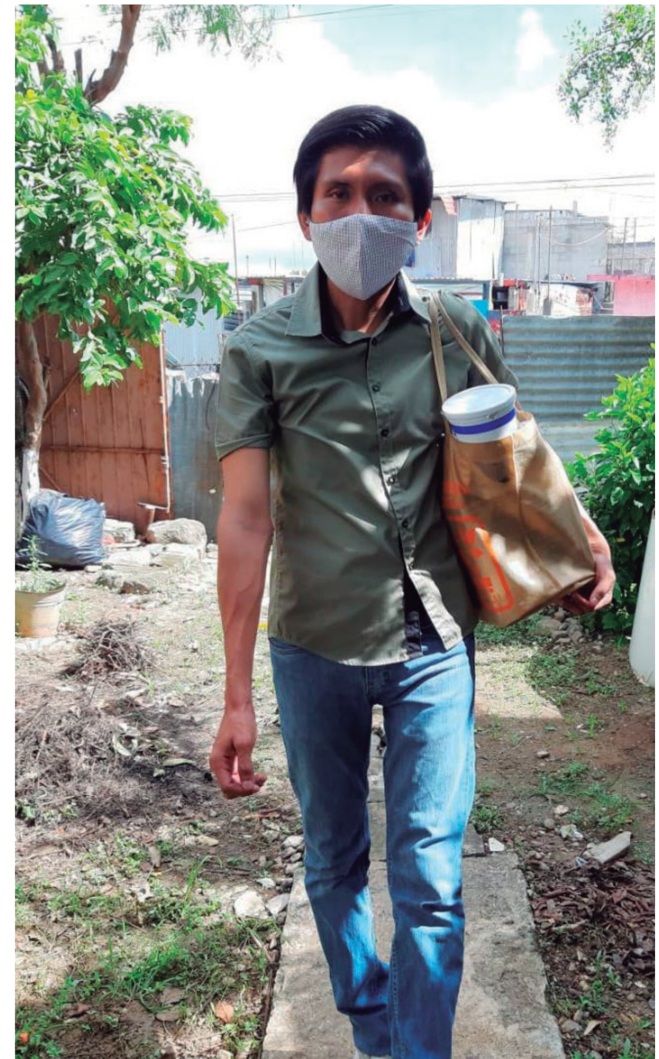
Ciudadano siguiendo las recomendaciones al salir a trabajar