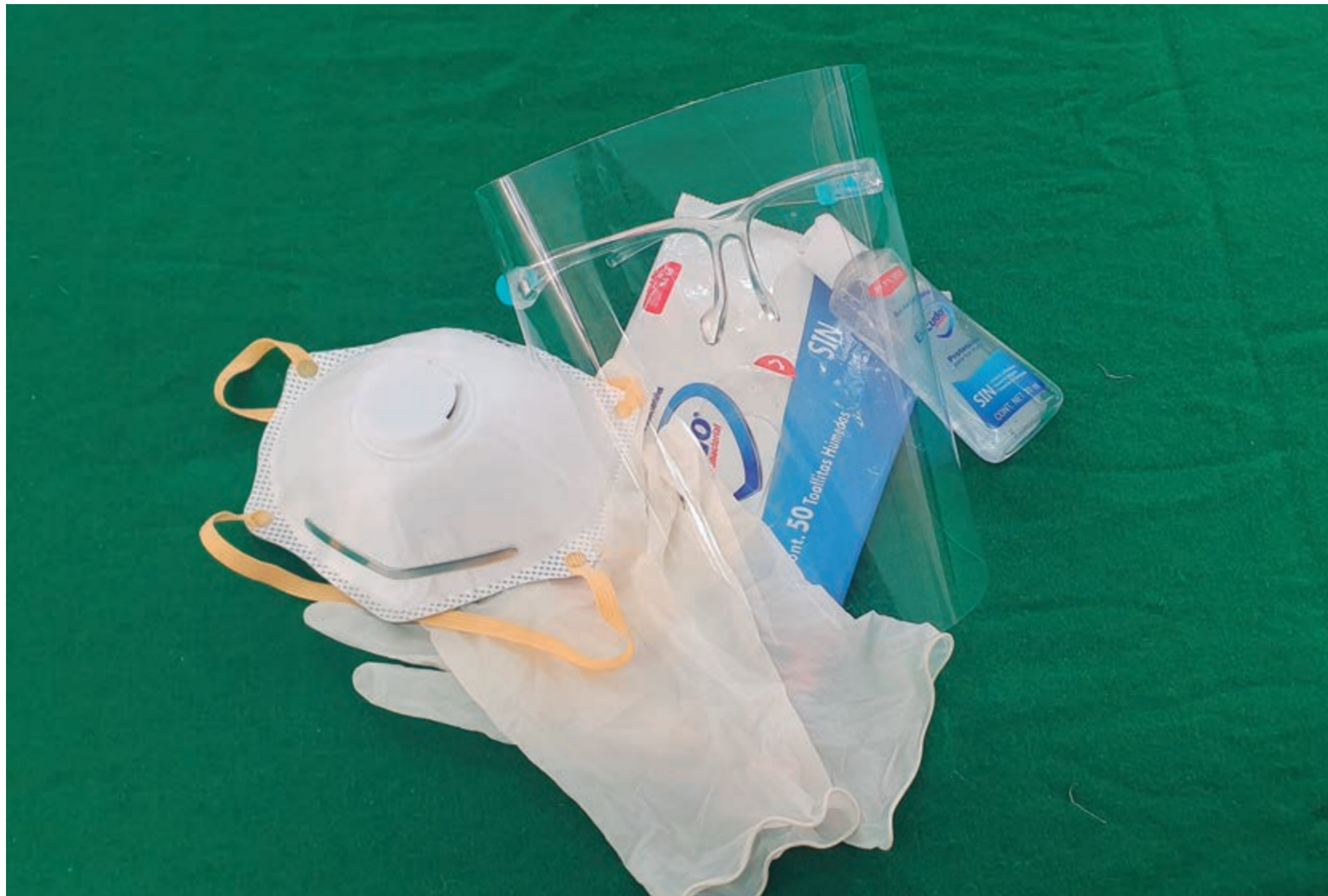
Kit de higiene durante el covid-19

El compromiso que como miembros de una determinada comunidad o sociedad, ya sea individualmente o en forma colectiva, asumimos para con la sociedad comunidad en su conjunto, que nos permita contribuir positivamente a su pleno desarrollo y armonía, se define como Responsabilidad Social.