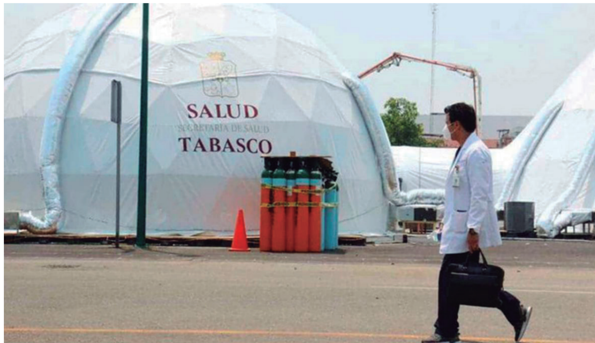
Personal Médico de Salud en Tabasco