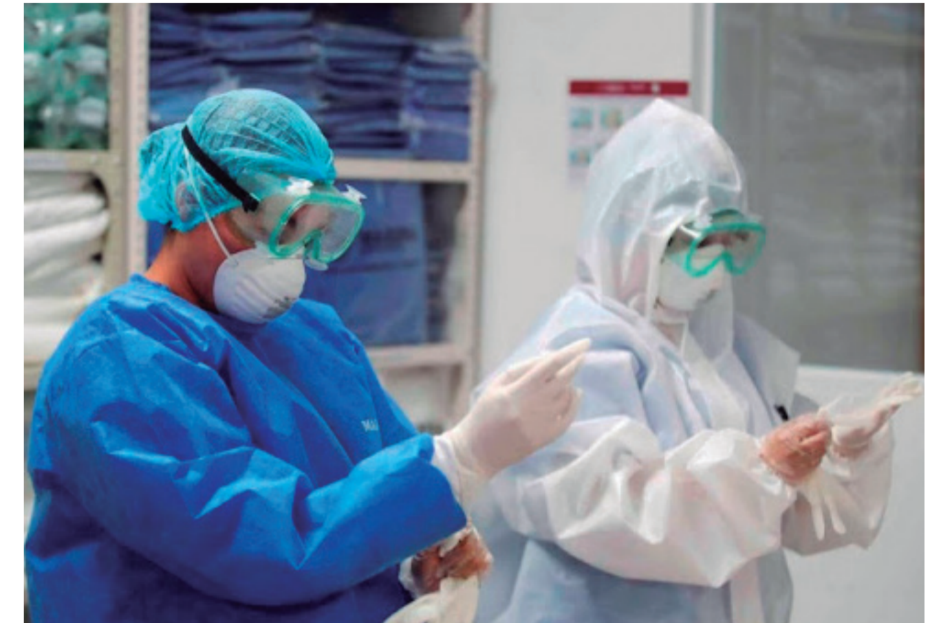
Personal Médico de Salud en Tabasco

e) Yucatán: Reformó el Código Penal para incrementar la sanción en materia de lesiones al personal de salud.