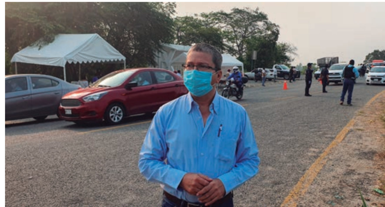
Pedro F. Calcáneo Argüelles, Presidente de la CEDH,

establecidos para garantizar el orden, la seguridad y salud de los ciudadanos, y sobre todo, el cumplimiento de la sana distancia y portación obligatoria de cubre bocas en conductores y peatones.